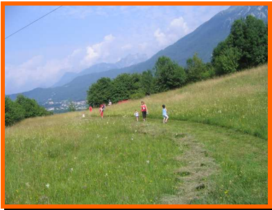
Un tratto del percorso