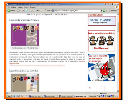
Pagina degli opuscoli