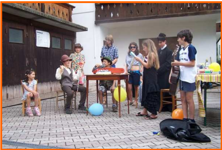
La giovane compagnia teatrale all'opera