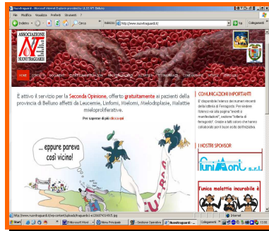
Pagina iniziale del sito

Nel corso del primo semestre del 2010 il sito di Nuovi Traguardi è stato completamente rinnovato. Tra le novità più importanti si segnala la pubblicazione on-line degli opuscoli dedicati ai pazienti. Inoltre, visti i rapidi progressi diagnostici e terapeutici cui si assiste in Ematologia sono disponibili aggiornamenti per ognuna delle malattie oncoematologiche. Vi invitiamo a visitare il sito al seguente indirizzo: www.nuovitraguardi.it .