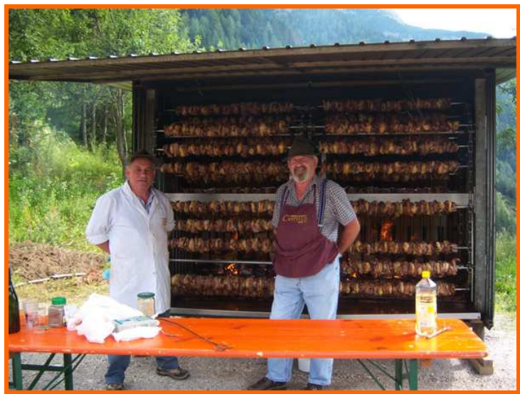
Lo spiedo gigante

Il ricavato, tra la lotteria (settemila biglietti venduti) e le due serate, ammonta a circa diecimila Euro che saranno impiegati per il finanziamento delle molteplici iniziative intraprese da Nuovi Traguardi.