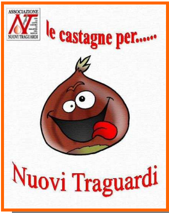
Il manifesto che reclamizza l'evento